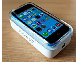
Gli italiani scoprono un trucco per avere l'iPhone quasi gratis