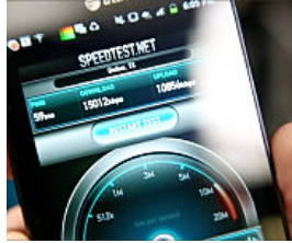
ADSL senza limiti , veloce , a prezzi imbattibili . Ecco chi la offre.