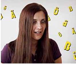
5 studenti e 8 parole di tedesco difficilissime: il video Babbel