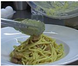
A Roma il re della carbonara è uno chef tunisino