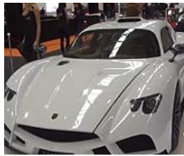
Roma, SuperCar 2015 alza la saracinesca: si apre il garage dei sogni proibiti