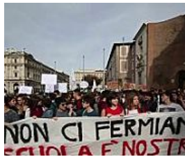
Roma: gli studenti sfilano al Colosseo contro la riforma della scuola