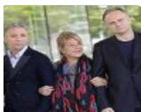
L'Estate di Falcone e Borsellino.