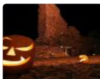
Zucche, ragni e vampirè