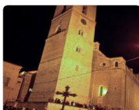
Incappucciati a Chieti